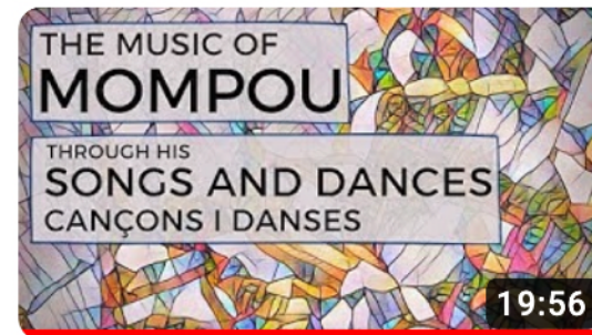
The music of Mompou through his "Songs &..."