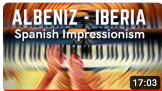
Analysis of Iberia by Albeniz. Spanish Impressionism