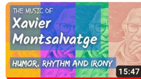
The music of Montsalvatge: Humor, rhythm and irony