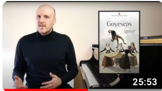
Analysis of Goyescas by Granados. (with subtitles)